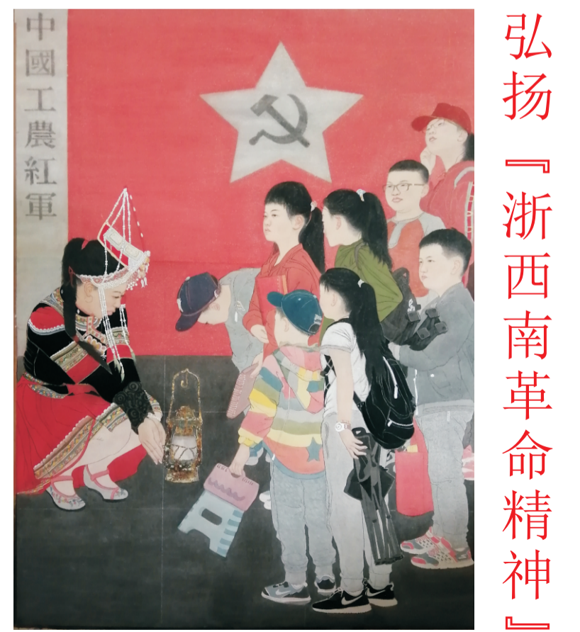
浙江省美术家协会会员 徐春平 画

据说，时任浙江省委书记的刘英又夺下另一士兵的枪。原来国民党士兵正在白岩头村抓壮丁，那年轻人是白岩头村民陈茂林。刘英将两士兵缴了枪，绑了，教育了一番，叫他们枪口对外，打日本鬼子。又和茂林一起将小武止了血，把伤口包扎好。趁着天黑，将小武背上翔龙洞，在洞中疗伤。刘英将小武托给陈茂林，自己连夜赶路，往金华方向而去，他是中共浙江省委书记，要在金华召开浙江省抗日宣传会议。半个月后，刘英从温州到金华办事，特地去翔龙洞看望伤员。并写下他的旧诗赠与护理伤员的陈茂林同志，署名王志运(刘英化名)。诗云：幼时不知路，今日上坦途。赤心献革命，决然无反顾。(李青葆 搜集整理)