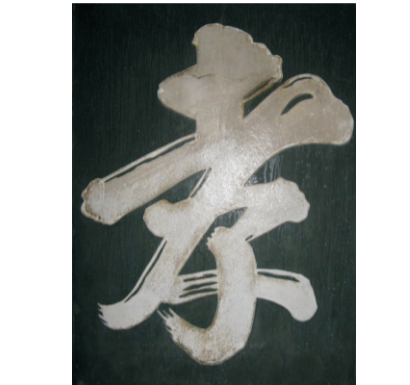
宋代理学家朱熹所书，孝字的上部酷似一位仰面作揖的人的形象，后脑象猴头，意寓不孝之人是畜生。

徐建存说，我父亲是中国标准的农民，在村里当过生产队长，当过会计，当过大队长，为丰衣足食而奋斗一生，没有留下什么财产，这十六字遗言是他留给儿孙们的精神财富，我们要记住它，要用好它。（李青葆）